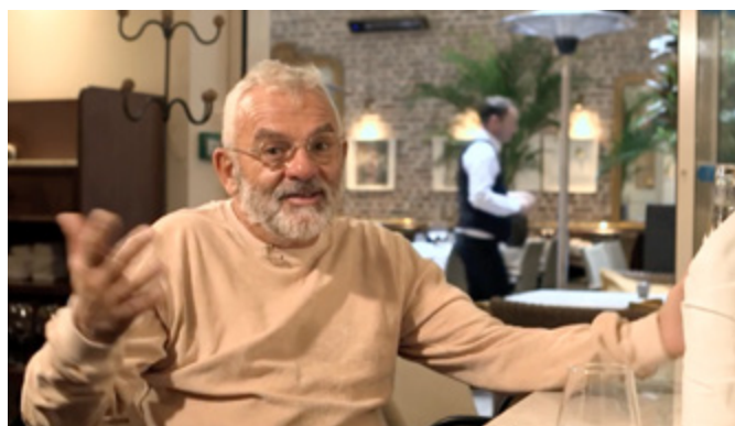
Rencontre avec Olivier Rouyer, ancien international français