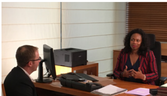
Rencontre de la Ministre des Sports Laura Flessel (2018)