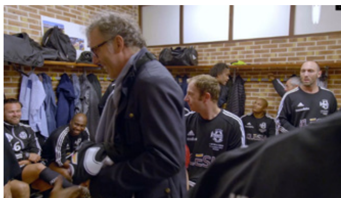
Vestiaire du Variétés Club de France