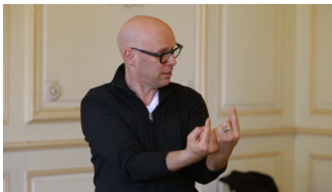
Intervention de Philippe Liotard, sociologue du sport, devant les étudiants de l'Université de Besançon