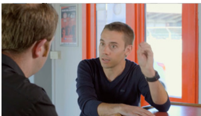
Rencontre avec Clément Turpin, arbitre international