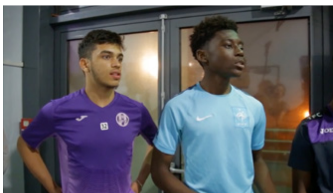
Intervention de la Compagnie du Trimaran devant les jeunes joueurs du Centre de Formation du FC Toulouse