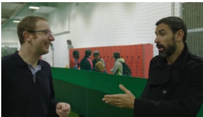
Rencontre d'anciens footballeurs professionnels Robert Pires, Laurent Blanc, mais également Jean Michel Larqué et Guy Roux.