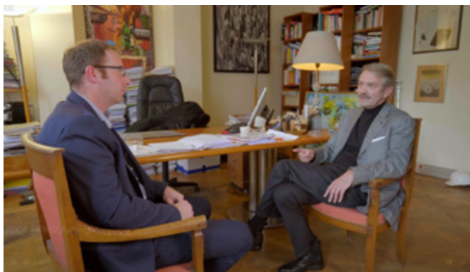
Rencontre avec Frédéric Thiriez, ancien président de la LFP