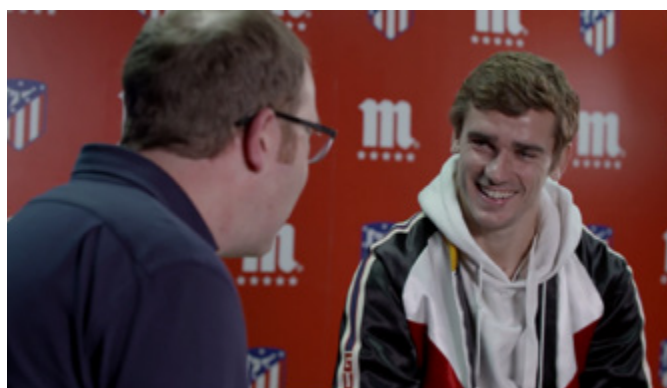
Rencontre avec Antoine Griezmann à Madrid