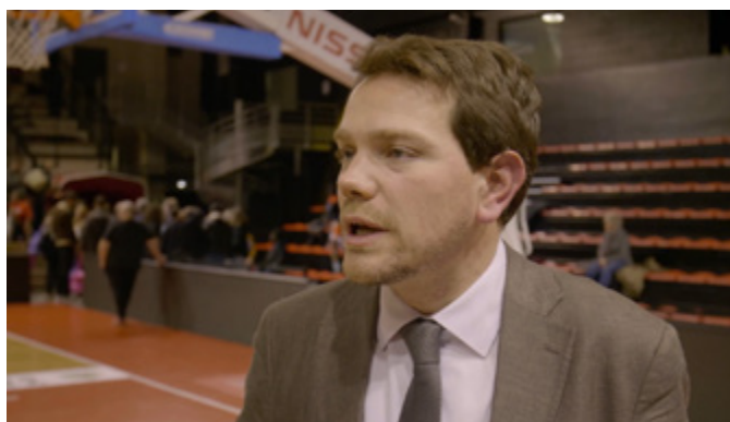
Rencontre avec Boris Ravignon, Maire de la ville de Charleville-Mézières